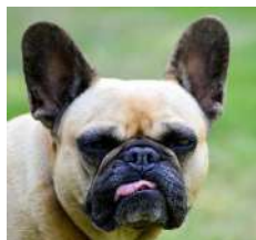
Amélie (Franse Bulldog): +32 498 29 99 73